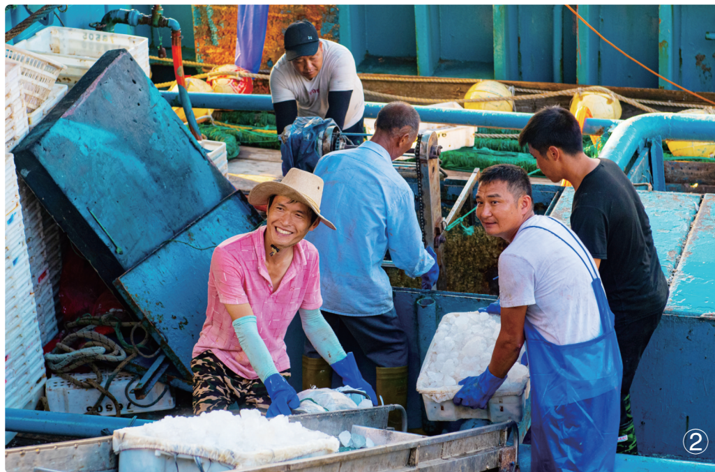
①、③在澳前中心渔港码头,渔民将刚捕捞回来的渔获就地售卖。 ②渔民用传送带运送渔获。 ④新鲜的渔获

夜愈深,返港渔船数量也在不断增加,一派繁忙景象也吸引了市民游客驻足观看。“第一次看到这么多的渔获,仿佛在看纪录片,当地人真的很幸福。”一名河南游客说。