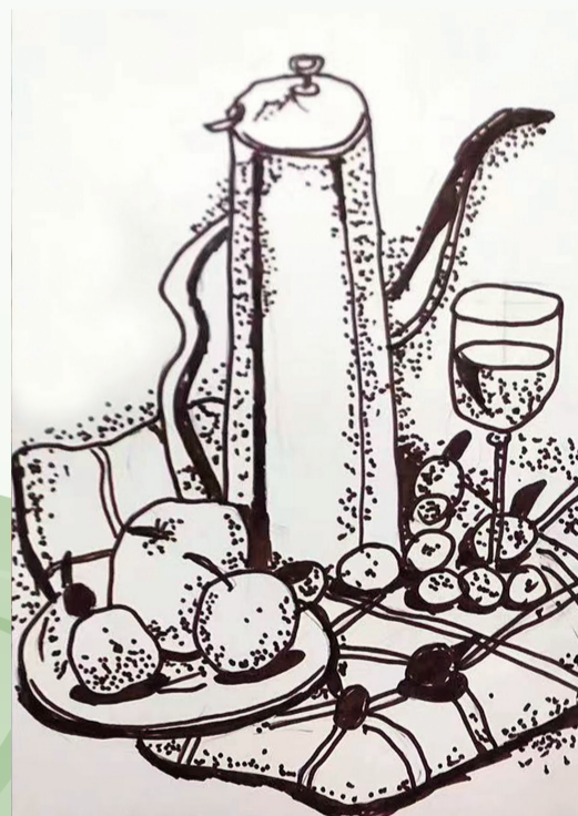
《厨房一角》平潭城中小学 三年(1)班 吴铭瑞