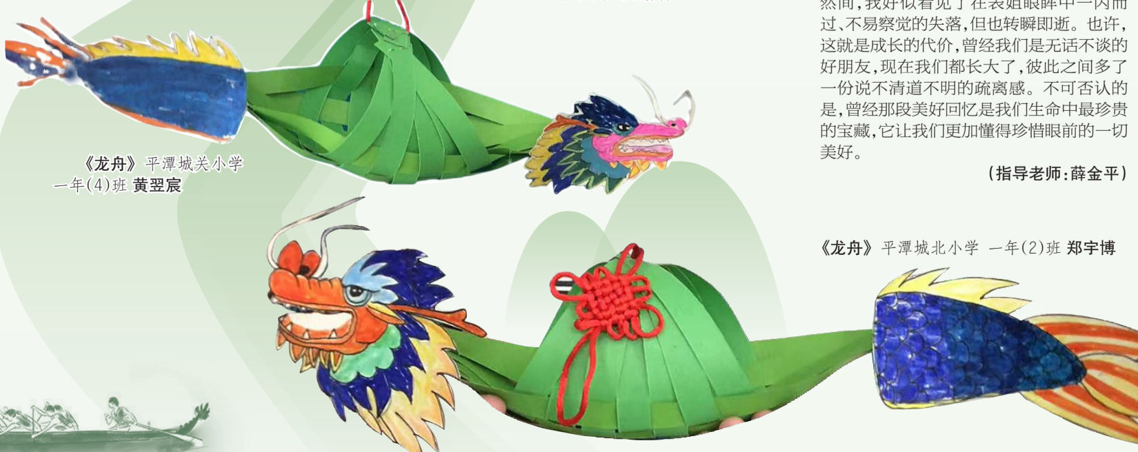
《龙舟》平潭城关小学 一年(4)班 黄翌宸