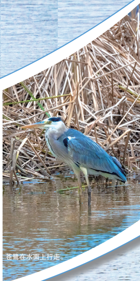
苍鹭在水面上行走。