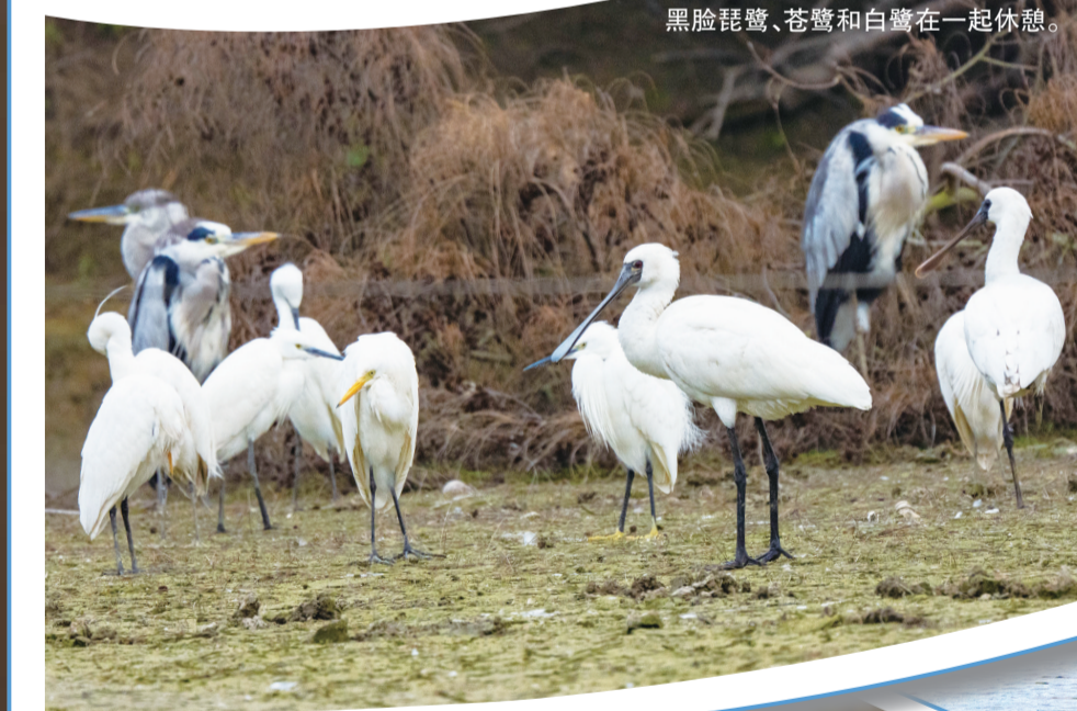
黑脸琵鹭、苍鹭和白鹭在一起休憩。