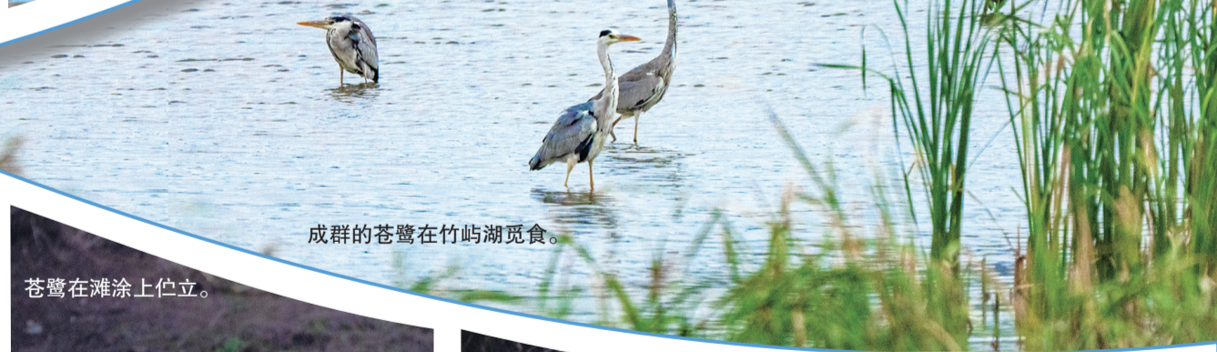
成群的苍鹭在竹屿湖觅食。