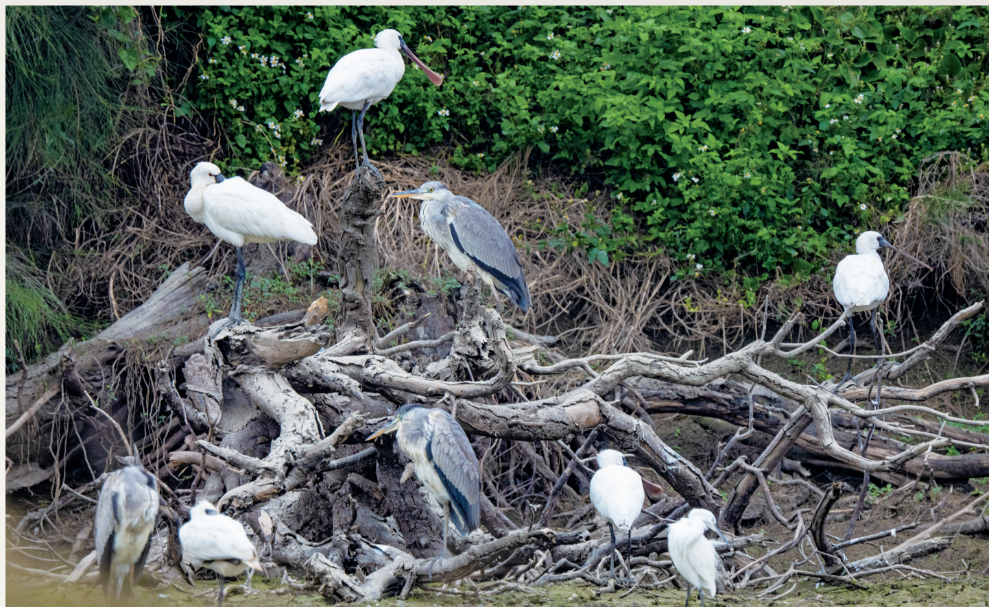
黑脸琵鹭、苍鹭和白鹭聚在一起。