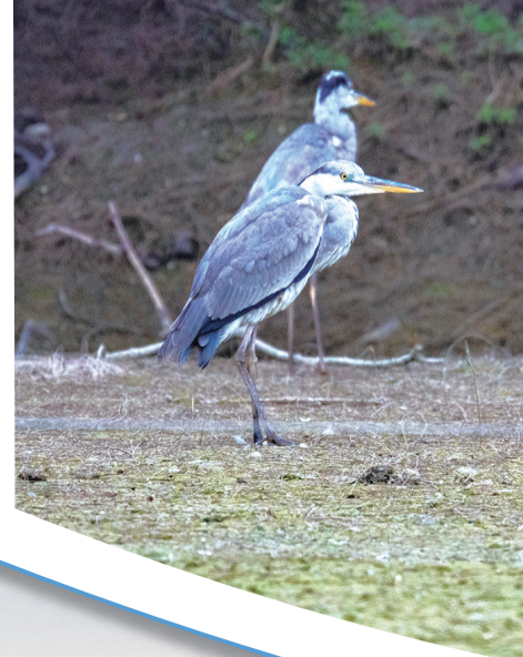
苍鹭在滩涂上伫立。