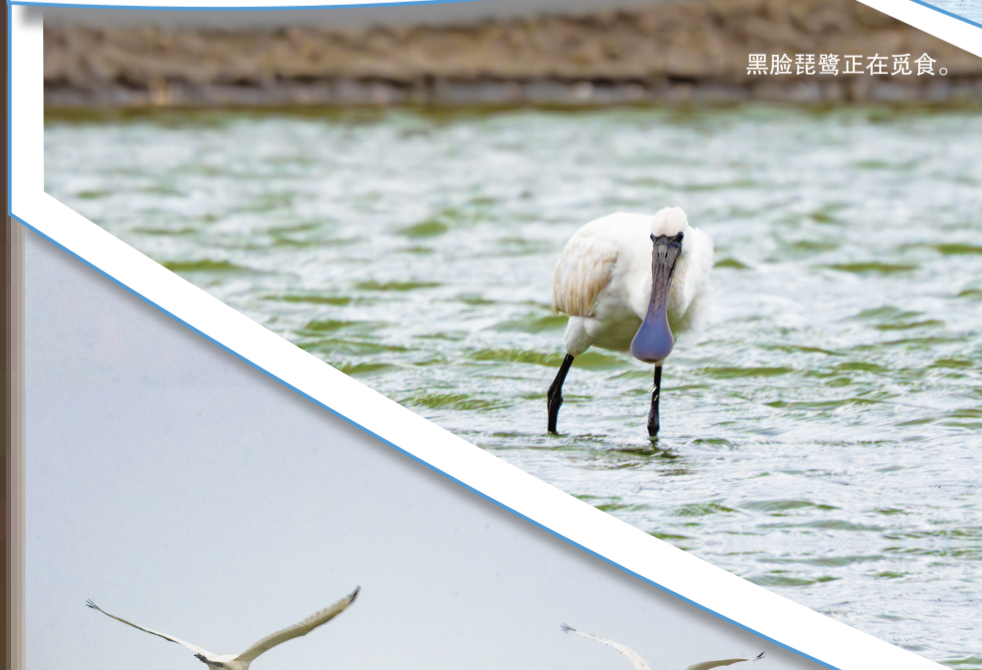
黑脸琵鹭正在觅食。