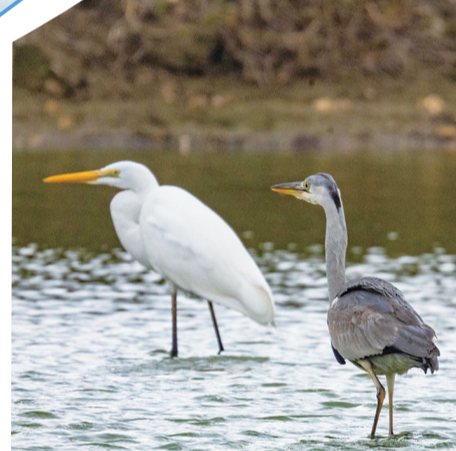
苍鹭和白鹭结伴玩耍。