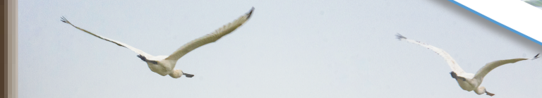
黑脸琵鹭自在翱翔。